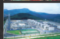
Division Systèmes électroniques et électriques