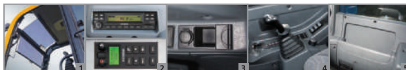
Pare-soleil enroulable Radio / MP3 avec télécommande Téléphone cellulaire mains libres Joysticks ergonomiques Compartiments de rangement