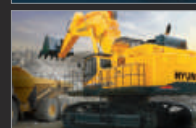
Division matériel de construction